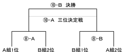
決勝トーナメント